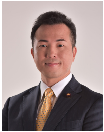
(特攻隊戦没慰霊顕彰会会員) 参議院議員 宇都 隆史

特攻隊慰霊顕彰会の皆様、明けましておめでとうございます。航空自衛隊出身、「空翔ぶ参議院議員」こと宇都隆史（うとたかし）です。昨年は公私に渡りご指導ご鞭撻を賜り、厚くお礼申し上げます。