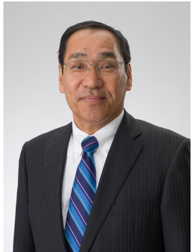
(特攻隊戦没慰霊顕彰会会員) 衆議院議員 中西 哲

昨年はコロナウィルス感染の急拡大で大変な一年でした、この原稿を書いている段階（11月25日）では、米国や英国で有効なコロナワクチンや治療薬の開発が進み、近いうちに市販されるとのニュースが流れておりますので、今年はこの騒動が早期に収まり、通常の生活に戻る事を願っております。